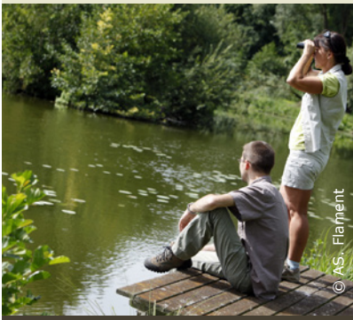
Dans le marais de Saint-Simon