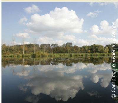
Marais à Seraucourt-le-Grand